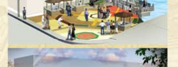
แนวความคิดการปรับปรุงพื้นที่ : เกาะกลางถนนสิบสามห้าง