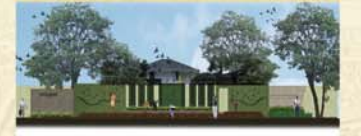
แนวความคิดการปรับปรุงพื้นที่ : ชุมชนแพ่งพุทธ