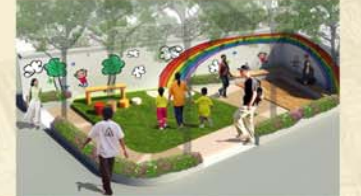
แนวความคิดการปรับปรุงพื้นที่ : ชุมชนโบสถ์พราหมณ์