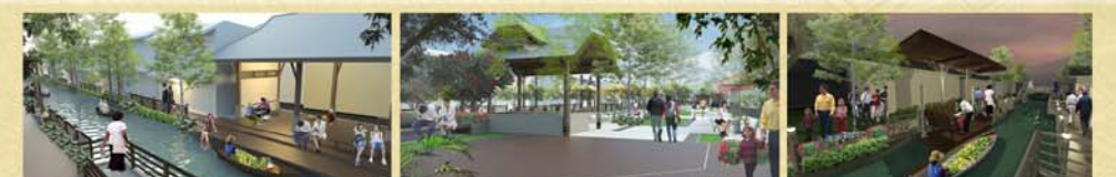
โครงการปรับปรุงและพัฒนาคลองหอยโข่งวัดราชบพิธและพื้นที่ริมคลอง