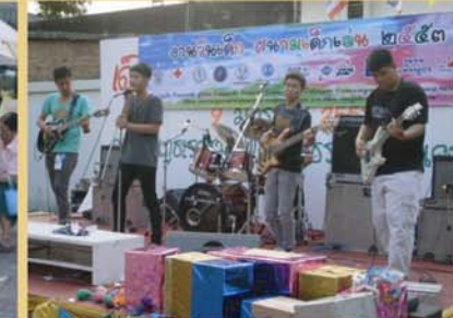
กิจกรรมงานวันเด็ก : ชุมชนแพร่งภูธร