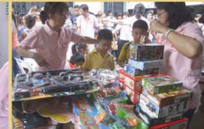
กิจกรรมงานวันเด็ก : ชุมชนโบสถ์พราหมณ์