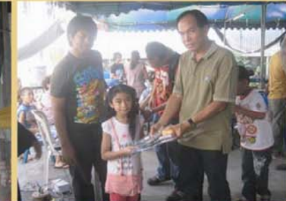
งานกุศลมัสยิดบ้านตึกดิน : ชุมชนมัสยิดบ้านตึกดิน